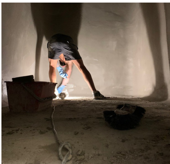
Le maçon s'active dans la cuve 10

La refecton des cuves que nous vous annoncions début Juin est en cours ; pour le moment le calendrier des travaux est respecté.