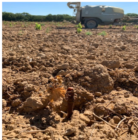
Celui-ci n'a pas survécu