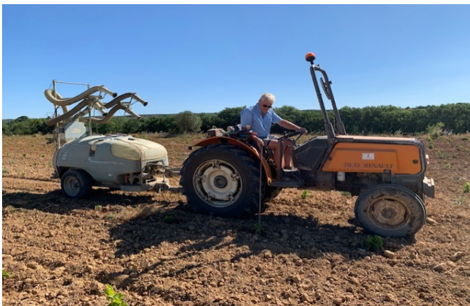
Le patron au travail pour une fois